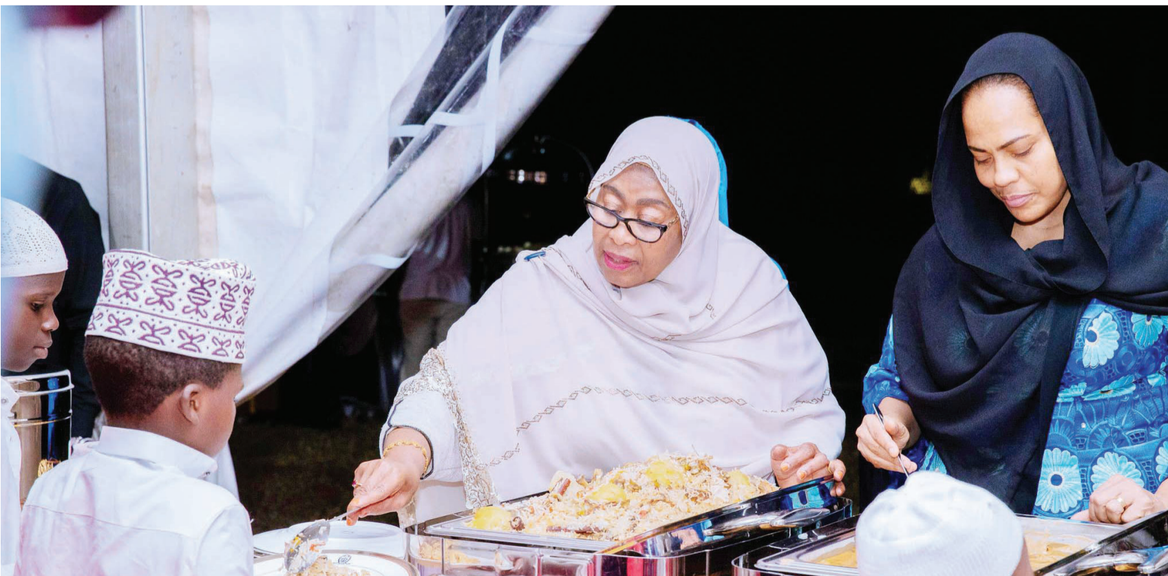
Picha mbalimbali za matukio wakati Rais Dk. Samia Suluhu Hassan alipofuturisha Watoto Yatima na Watoto wenye mahitaji Maalum, Ikulu Jijini Dar es Salaam, juzi.