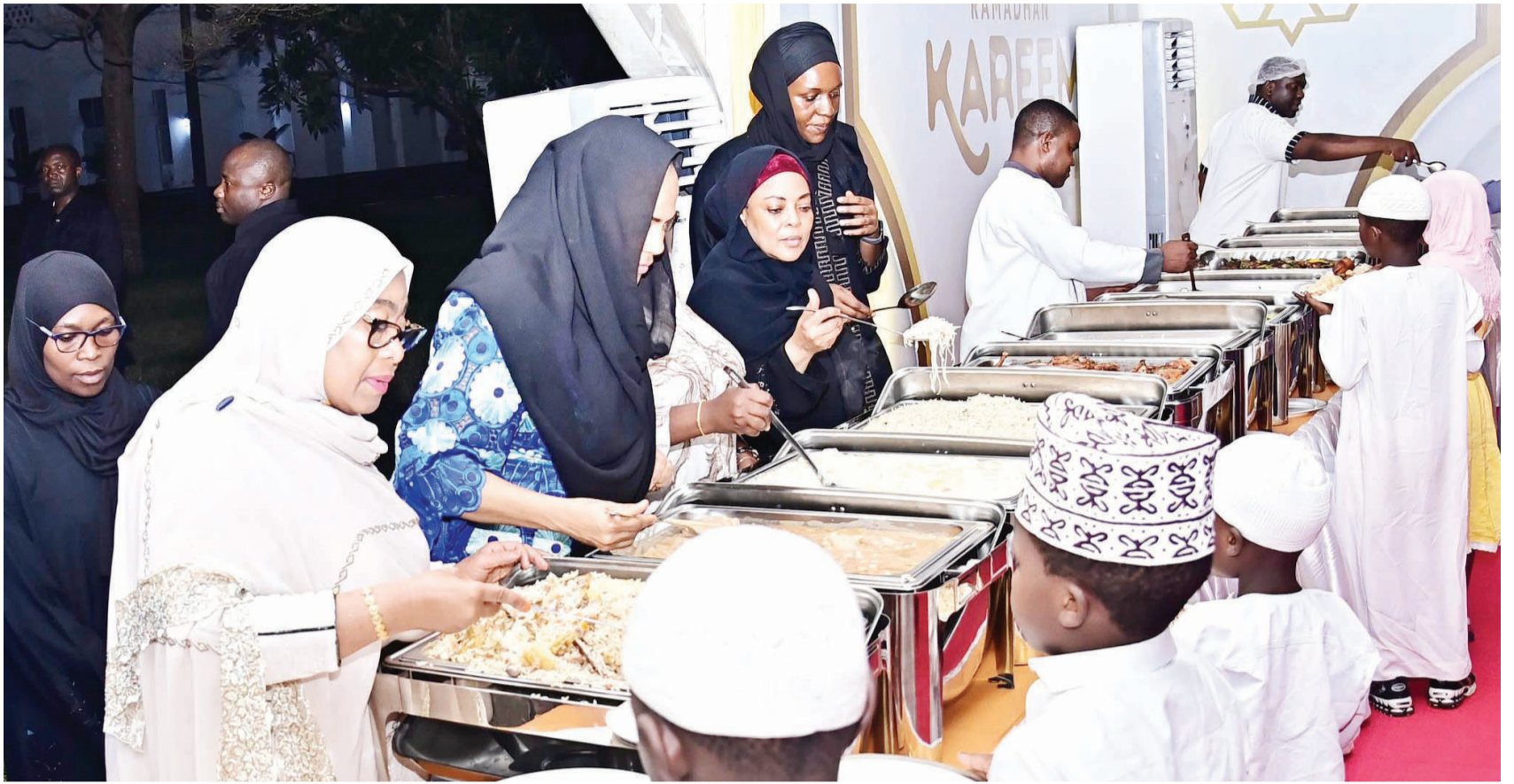
Picha mbalimbali za matukio wakati Rais Dk. Samia Suluhu Hassan alipofuturisha Watoto Yatima na Watoto wenye mahitaji Maalum, Ikulu Jijini Dar es Salaam, juzi.