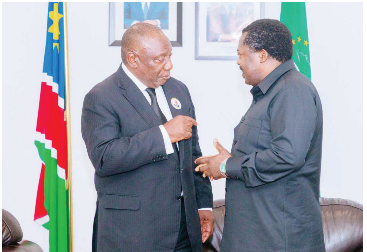
Rais wa Jamhuri ya Afrika ya Kusini, Cyril Ramaphosa akizungumza jambo na Katibu Mkuu wa Chama Cha Mapinduzi (CCM), Balozi Dk. Emmanuel John Nchimbi, walipokutana Uwanja wa Ndege wa Kimataifa wa Hosea Kutako, Windhoek, nchini Namibia, baada ya mazishi ya Rais wa Kwanza wa Namibia na Baba wa Taifa hilo, Dk. Sam Shafiqhuna Nujoma, mwishoni mwa wiki.