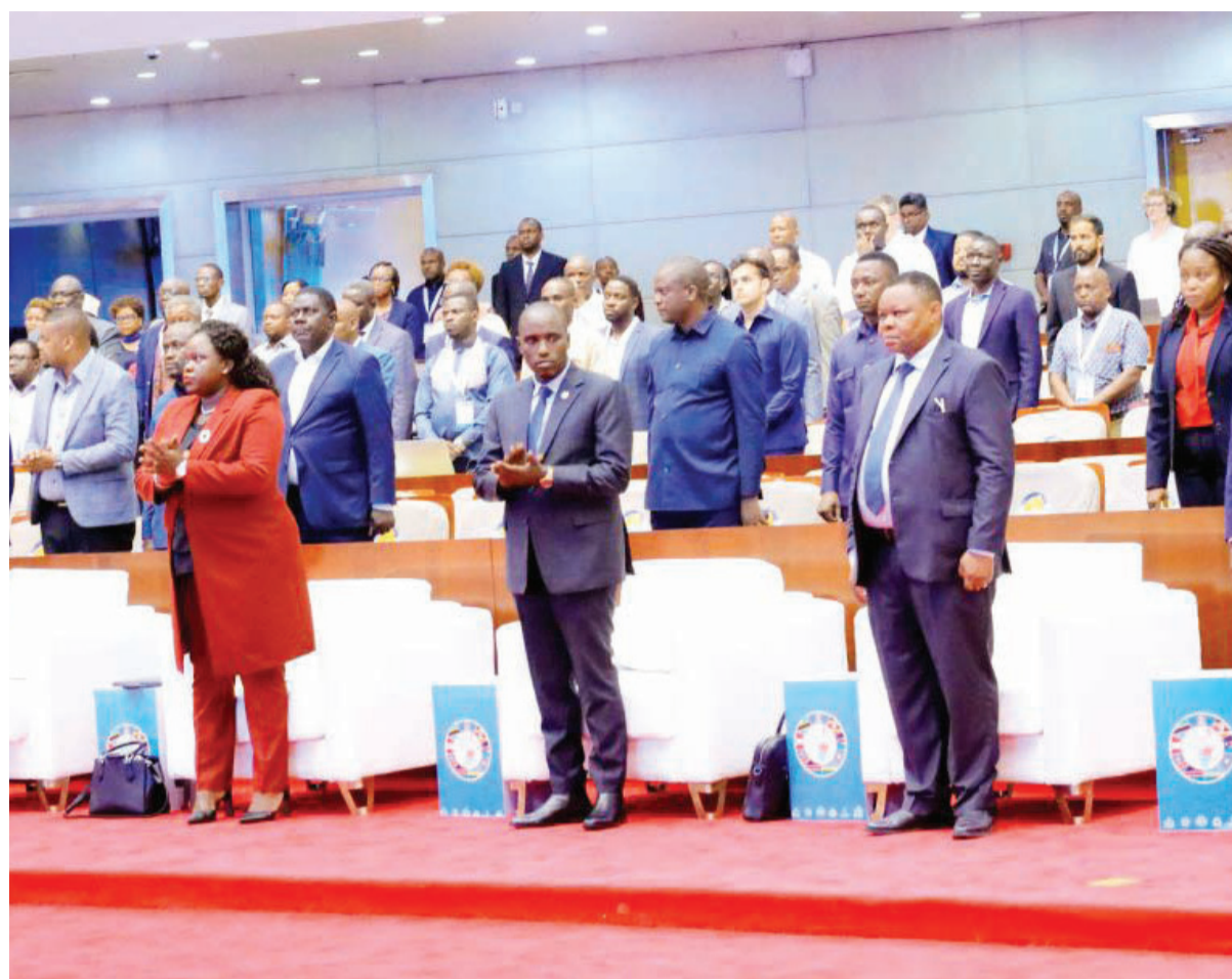
Naibu Waziri Mkuu na Waziri wa Nishati, Dk. Doto Biteko (katikati) wakati wa ufunguzi wa Mkutano wa Awali wa Kongamano la Mafuta na Gesi la Jumuiya ya Afrika Mashariki (EAPCE'25), Ukumbi wa Mikutano wa Kimataifa wa Julius Nyerere (JNICC) jijini Dar es Salaam, jana.

Gazeti hili hutolewa na JAMVI MEDIA GROUP S. L. P 78862, Dar es Salaam Tel: +255 676 807684, 255 743 777778 Email: jamvinews@gmail.com www.jamvilahabari.co.tz