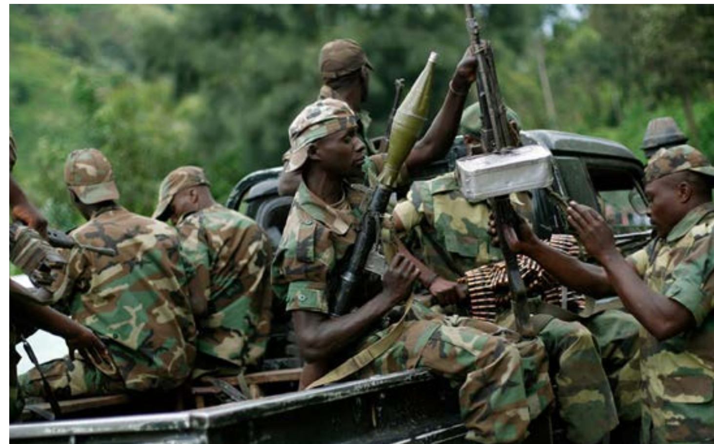
Na Mwandishi Wetu