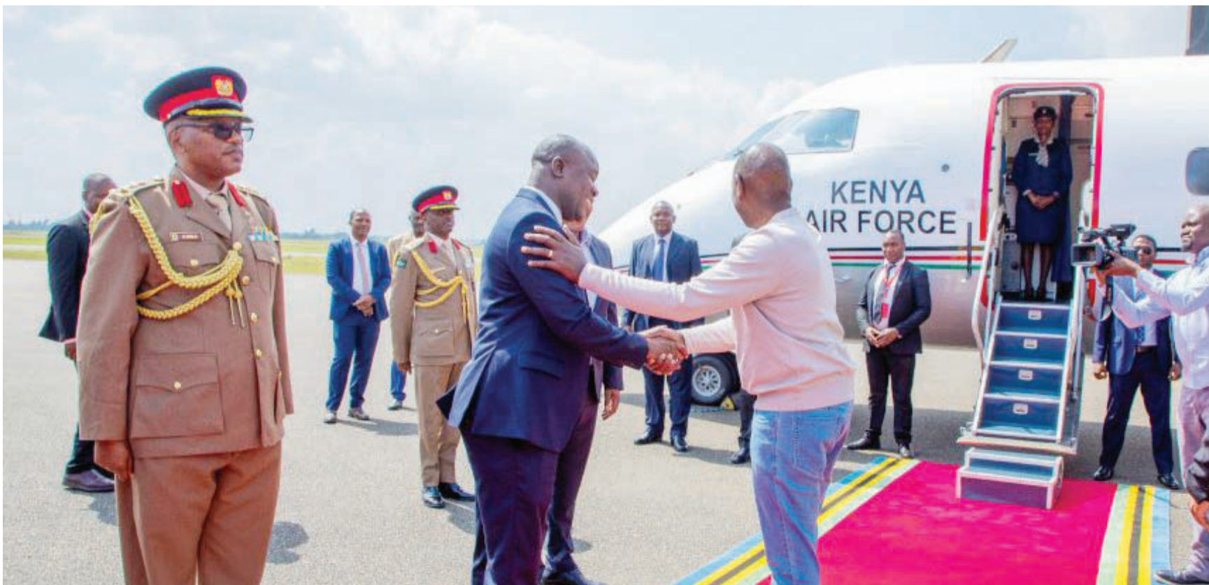
Picha mbalimbali zikimuonyesha Mwenyekiti wa Jumuiya ya Afrika Mashariki (EAC) ambaye pia ni Rais wa Jamhuri ya Kenya, William Ruto akiondoka nchini Tanzania baada ya kuhudhuria mkutano wa SADC na EAC uliofanyika jijini Dar es Salaam, juzi.