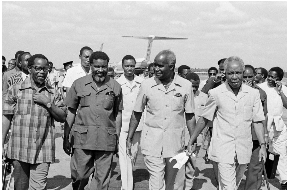
Wapigania uhuru wa Afrika na wanaharakati wa ukombozi wa Kusini mwa Afrika wakiwa katika picha ya pamoja kutoka kushoto Oliver Tambo wa Afrika Kusini, Sam Nujoma wa Namibia, Keneth Kaunda wa Zambia na Julius Nyerere wa Tanzania. Kwa sasa hawa wote ni marehemu ambapo aliyefunga pazia ni Sam Nujoma aliyefariki jana.