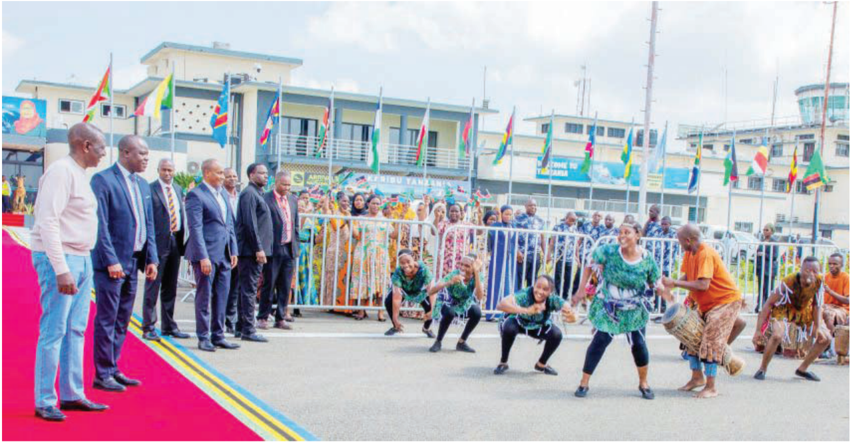
Picha mbalimbali zikimuonyesha Mwenyekiti wa Jumuiya ya Afrika Mashariki (EAC) ambaye pia ni Rais wa Jamhuri ya Kenya, William Ruto akiondoka nchini Tanzania baada ya kuhudhuria mkutano wa SADC na EAC uliofanyika jijini Dar es Salaam, juzi.