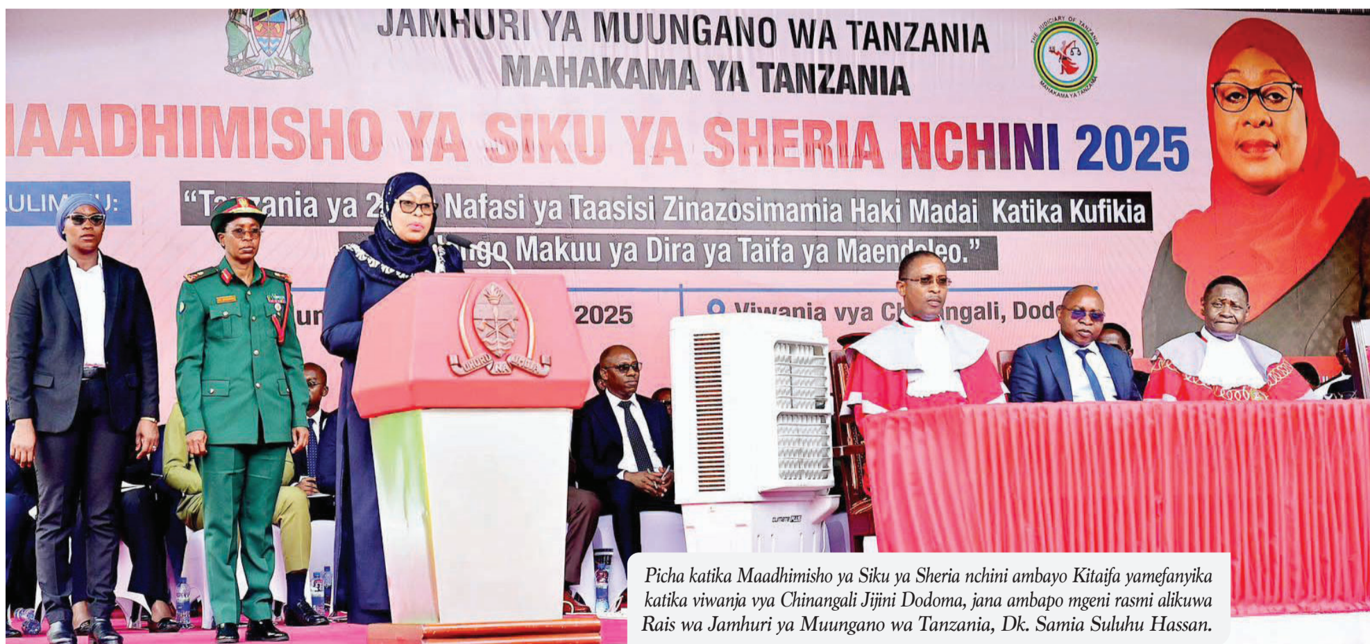
Picha katika Maadhimisho ya Siku ya Sheria nchini ambayo Kitaifa yamefanyika katika viwanja vya Chinangali Jijini Dodoma, jana ambapo mgeni rasmi alikuwa Rais wa Jamhuri ya Muungano wa Tanzania, Dk. Samia Suluhu Hassan.

>> Ni dalili tosha ya ushindi wa kimbunga Oktoba Uk.2