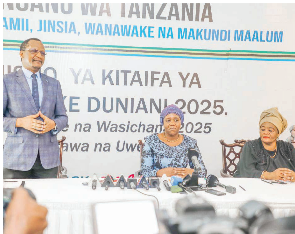
Waziri wa Maendeleo ya Jamii, Jinsia, Wanawake na Makundi Maalum, Dk. Dorothy Gwajima (katikati) akiwa katika mkutano na waandishi wa Habari kuelezea Maadhimisho ya Siku ya Wanawake Duniani kwa mwaka 2025.

Gazeti hili hutolewa na JAMVI MEDIA GROUP S. L. P 78862, Dar es Salaam Tel: +255 676 807684, 255 743 777778 Email: jamvinews@gmail.com www.jamvilahabari.co.tz