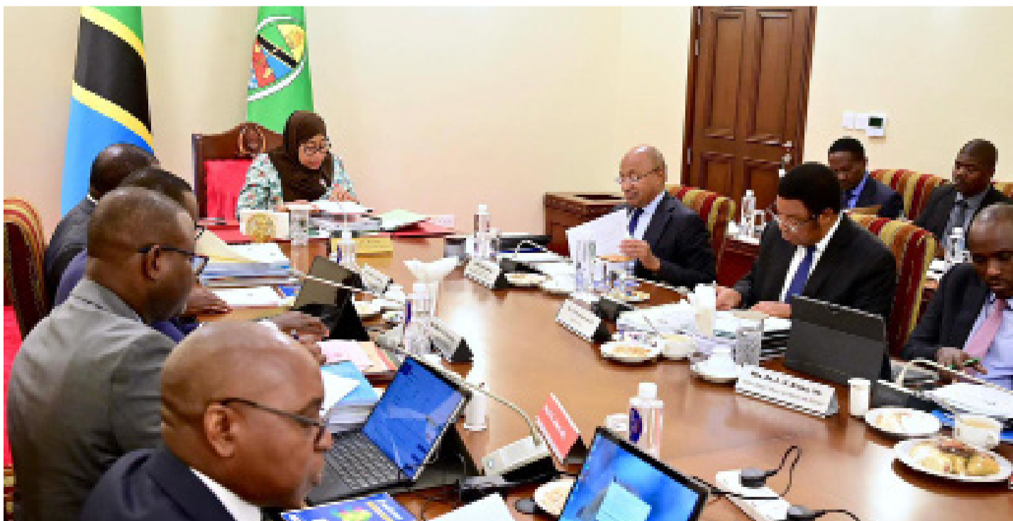
Picha mbalimbali Rais wa Jamhuri ya Muungano wa Tanzania, Dk. Samia Suluhu Hassan akiiongoza Kikao cha Baraza la Mawaziri kilichofanyika Ikulu Chamwino, Mkoani Dodoma, jana.

Amesema Tanzania ina asili nyingi, hivyo wanaamini iwapo soko hilo la China litatumia vizuri wazalishaji wa asali watanufaika.