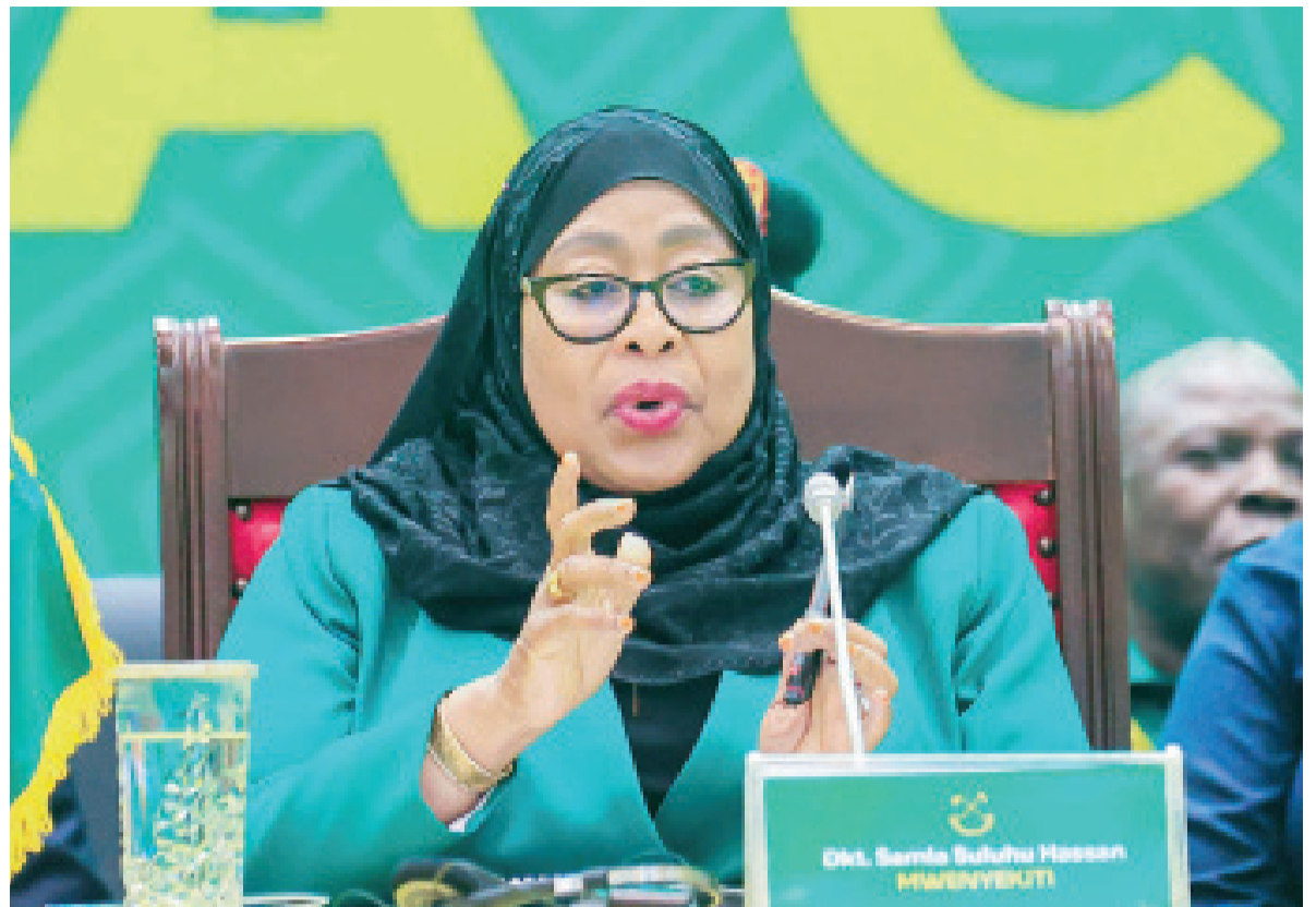
Mwenyekiti wa Chama cha Mapinduzi (CCM) na Rais wa Jamhuri ya Muungano wa Tanzania Ndugu. Dkt. Samia Suluhu Hassan akiwa pamoja na viongozi mbalimbali katika Mkutano Mkuu Maalum wa CCM Taifa uliofanyika kwenye ukumbi wa Jakaya Kikwete Jijini Dodoma jana tarehe 19 Januari, 2025.