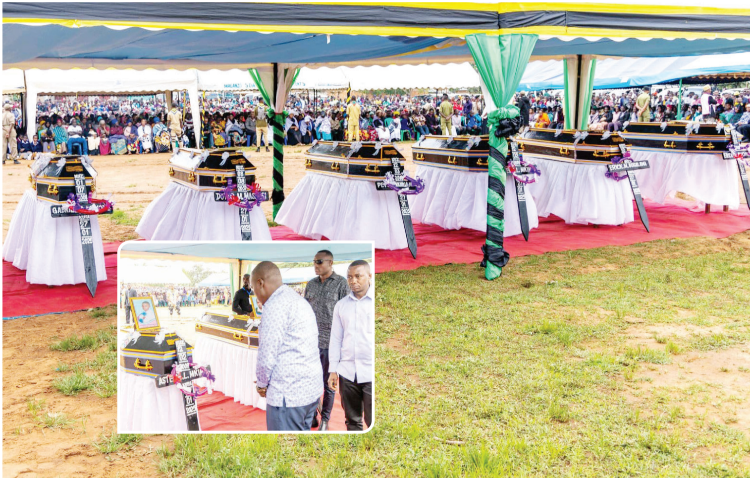
Majeneza saba ya miili ya wanafunzi wa Shule ya Sekondari Businda, Wilayani Bukombe Mkoa wa Geita waliofariki kwa kupigwa na radi, wakiwa Darasani Januari 27, 2025