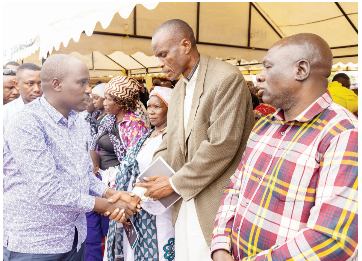
Naibu Waziri Mkuu na Waziri wa Nishati, Dk. Doto Biteko akitoa mkono wa pole jana kwa ndugu jamaa na familia ya wanafunzi waliopoteza maisha kutoka na radi iliyotokea